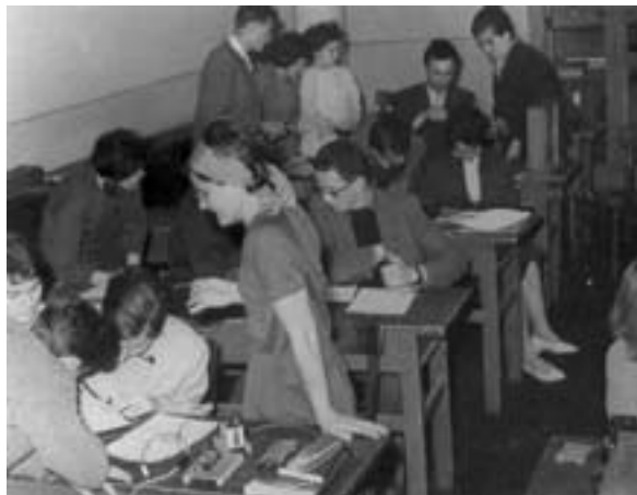
На часу физике 1963.