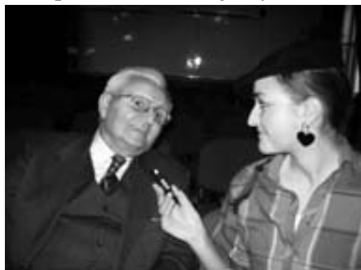
Проф. др Милан Шипка у бечејској Гимназији