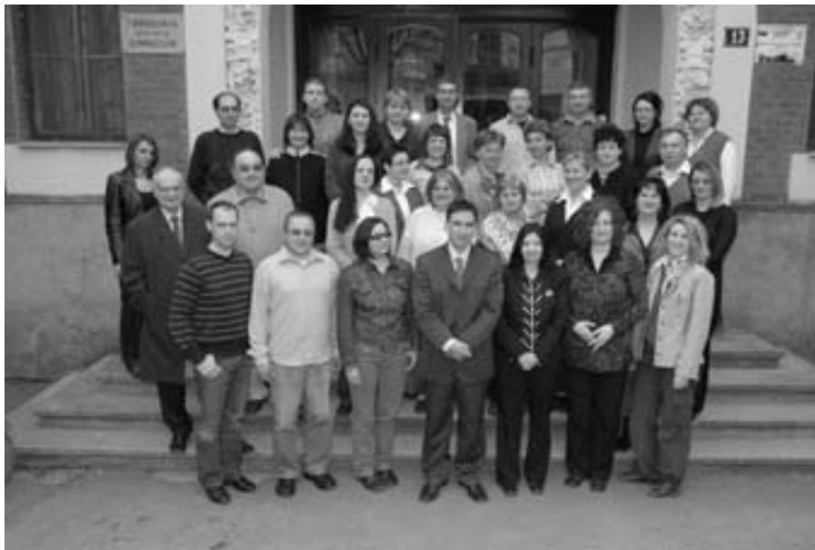
Колектив Гимназије школске 2007/2008. године

Због немогућности да се обезбеди одговарајући наставни кадар, у одељењима са мађарским наставним језиком настава на српском језику се изводила из предмета филозофије и социологије.