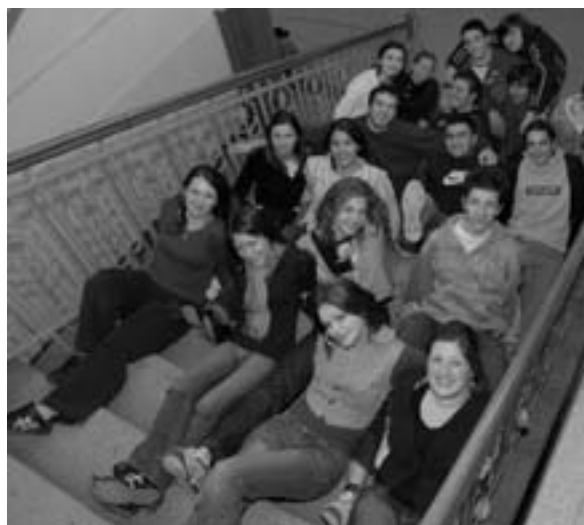
Први Ђачки парламент бечејске Гимназије

Поводом Дана заљубљених Ђачки парламенти свих средњих школа у Бечеју организовали су хуманитарну журку у клубу „ Стеји “ и том приликом сакупили значајна новчана средства за децу из ШОСО „Братство“.