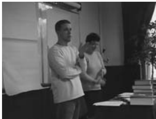
Билингвални час - српски и мађарски језик

Протекле школске године професори Гимназије су са задовољством прихватили да учествују у пројекту унапређења интеркултуралног образовања у бечејској Гимназији . Пројекат се реализовао у мултимедијалној учионици, уз коришћење савремених наставних средстава и примену нових метода и облика рада. На часовима билингвалне наставе заједно раде ученици српских и мађарских одељења, а професори су билингвални или мултилингвални. Примењивали су се и елементи сценског приказа и драмске педагогије.