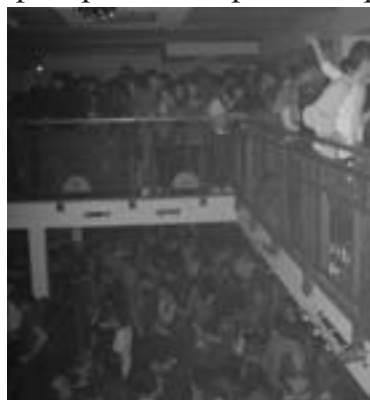
Хуманитарна журка у кафићу „Стеји” у организацији средњошколских ђачких парламената

Пунолетни ученици су учествовали у акцији добровољног давања крви које је организовао Црвени крст у октобру и мају месецу. Ученици су добровољно и радо учествовали у свим таквим акцијама које су организоване у Бечеју током године.