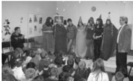
Новогодишња представа за децу из „Братсва“

Неколико акција које је организовао Ђачки парламент биле су хуманитарног типа. Прво су ученици Гимназије и Економско-трговинске школе сакупљали играчке и слаткише те правили новогодишње пакетиће за децу из ШОСО