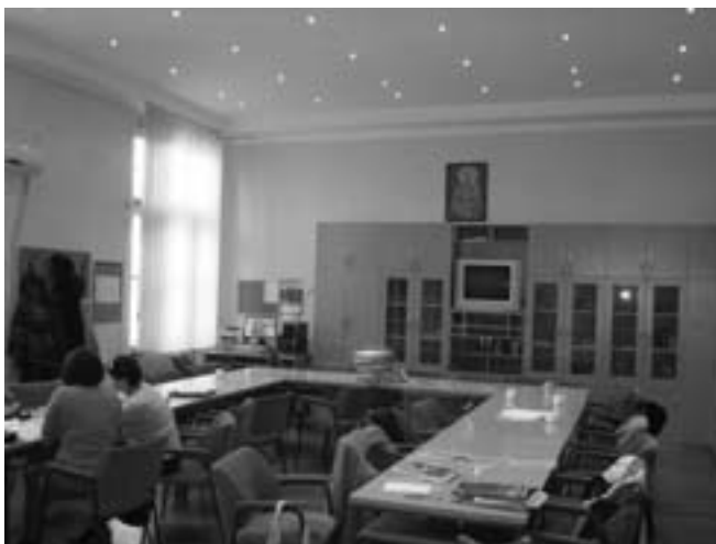
Нови изглед зборнице

Од средстава које је школа добијала од СО Бечеј урађена је кровна конструкција изнад ћачког улаза , такође је дограђен видео надзор, затим је урађена израда геодетског извештаја , тј. анализа тла око зграде Гимназије, и на основу тога израда пројекта одвођења атмосферске воде и санација подрумских просторија . Затим је купљена интерактивна табла у математичком кабинету , која у потпуности