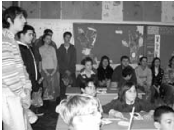
Парламентарци у посети „Братству“ након хуманитарне акције