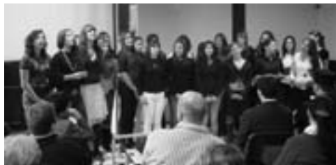
Приредба поводом Дана просветних радника

У јануару месецу, поводом дана Светог Саве, и ове године је свечано обележен овај дан. У школи је приређена свечана академија са врло богатим културно-уметничким програмом у организацији и извођењу ученика и професора школе. Том приликом најбољим ученицима и професорима уручене су пригодне награде. Такође су ученици школе учествовали на Светосавском турниру у организацији ОСЦ „Младост“.