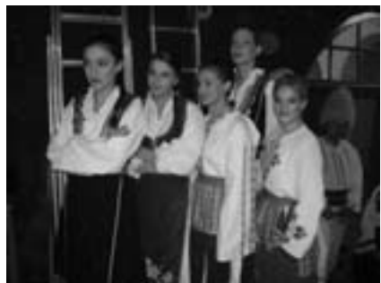
Певачки састав „Дамар“ из Гимназије на фестивалу „Етнос“

У оквиру музичке секције формиран је певачки састав „Дамар“ који се бави извођењем изворне српске музике. Овај етно састав веома брзо је постао незаобилазан елеменат безмало свих културних догађања у Бечеју и околини, те тако иза себе има већ десетине наступа у Гимназији и другим школама, у Народној библиотеци Бечеј, Дому културе, као и на фестивалима изворне музике.