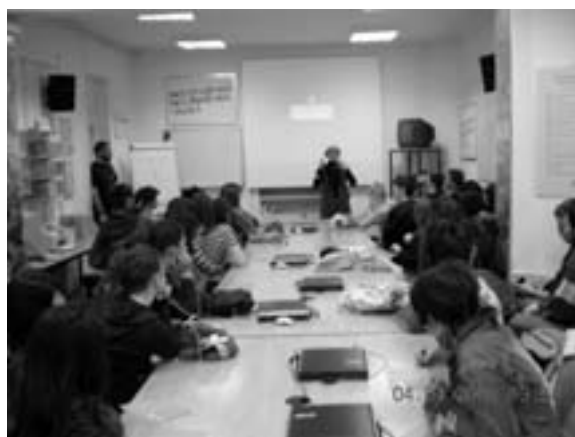
Редакције школских новина на предавању у Новосадској новинарској школи