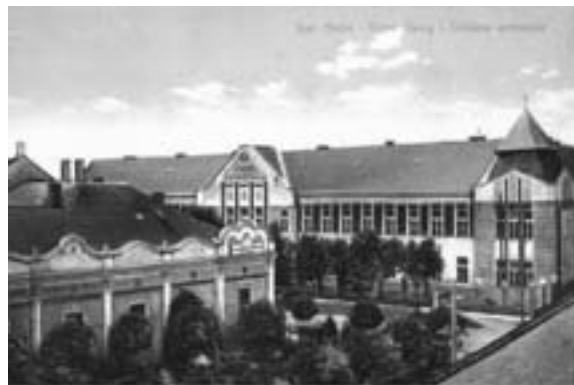
Стара разгледница Бечеја на којој се види зграда Гимназије