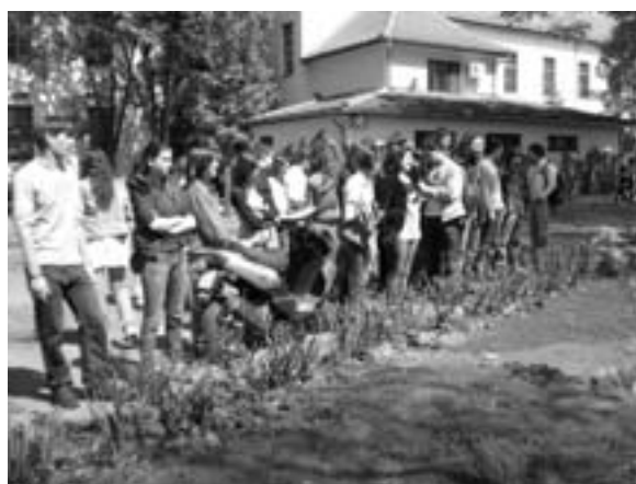
Сађење дрвета пријатељства ученика панчевачке и бечејске гимназије

У школској 2007/2008. години остварена је веома добра сарадња како са осталим школама у Бечеју тако и са школама у окружењу. Трајнија и ближа сарадња остварена је са Гимназијом „Урош Предић“ из Панчева и са Гимназијом „Гарај Јанош“ из Сексарда. Такође, сарадња са друштвеним и привредним организацијама била је на задовољавајућем нивоу уз приметно већу укљученост ученика и запослених у школи.