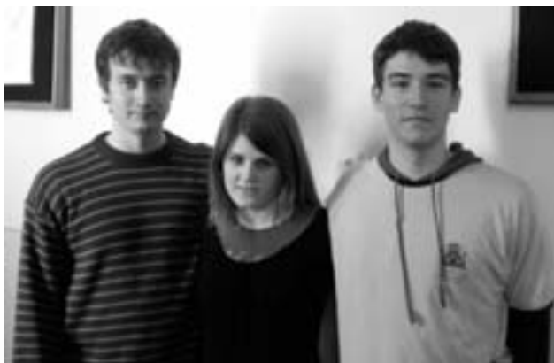
Учесници у квизу „Здраво, Европо“