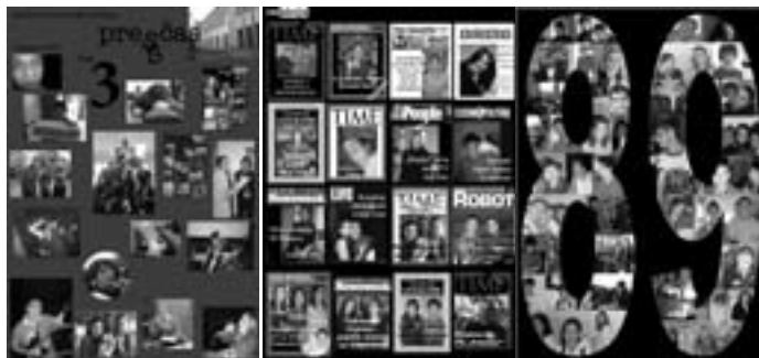
Издања „преССчас“ у школској 2007/2008. години