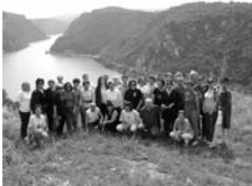
Колектив Гимназије на екскурзији у јуну

У јуну 2008. године организован је дводневни излет за професоре и ненаставно особље у правцу Сребрног језера и Ђердапа .