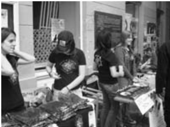
„Космополите“ у кампањи „Пази да се не уплетеш“

Треба напоменути да се неколико наших ученика, као и сваке године, обучавало у Истраживачкој станици Петница .