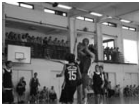
Кошаркаши Гимназије у Сексарду

У Сексарду у Мађарској ученици школе су учествовали у спортом