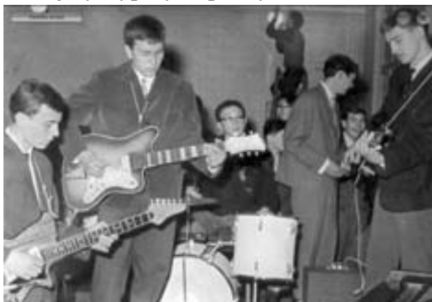
Школски бенд 1963.

У периоду свога експерименталног рада Гимназија је добила читав низ значајних признања и то: награду „8. октобар” Општине Бечеј 1968. године, прву награду у акцији „Година квалитета” у средњим школама Војводине 1974. године, Златну плакету Савеза физичке културе Војводине за успешну активност у физичкој култури у периоду од 1945- 1975. године, Велику плакету Црвеног крста