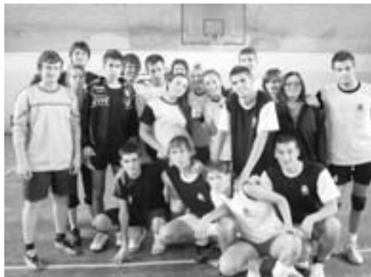
Одбојкашки тим Гимназије на „Купу толеранције“

У оквиру пројекта Извршног већа АПВ, Покрајинског секретеријата за прописе, управу и националне мањине, у пројекту „Афирмација мултикултурализма и толеранције у Војводини“, у Бачкој Тополи Гимназија је учествовала на такмичењу „ Куп толеранције “. У категорији одбојке (мешовито), као и у категоријама мушке и женске кошарке, наша Гимназија се пласирала међу прве три екипе. Учествовало је укупно тридесет седам ученика школе, а екипе су се пласирале на финале такмичења у Суботици.