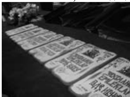
Захвалнице израђене на калиграфској секцији